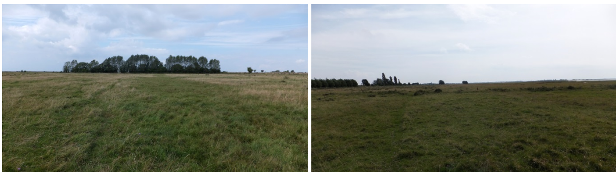
Figur 3. Det utpekade området för grävning av nya vatten samt faunadepåer. Till vänster i figuren norra delen och till höger södra delen.

Inom området (Figur 2, Figur 3) är planen att nyskapa ca 3 000 m 2 vatten fördelat på 4-5 st dammar. Dessa ska placeras minst 0,4 m över dagens havsnivå för att minska risken för översvämning av havsvatten i framtiden. Inom området (Figur 2, Figur 3) ska även ca 3 st faunadepåer skapas för att förbättra övervintringsmöjligheterna för groddjuren i området.