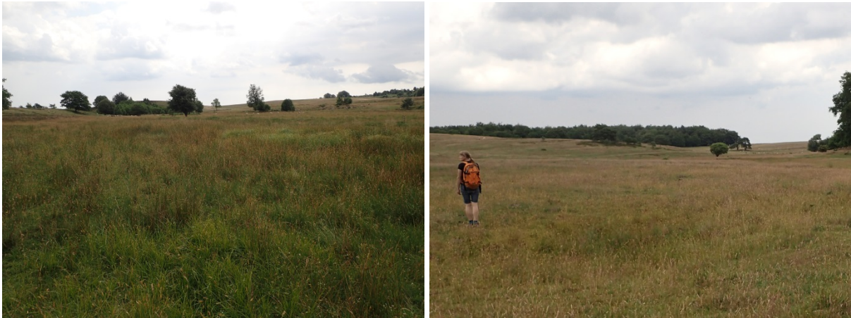
Figur 6. Områden där nya grunda vatten ska anläggas för strandpadda. Till höger område 2 (enligt numrering i karta, figur 2) och till vänster område 3.

Det finns även två områden där man kan skapa nya grunda vatten för strandpadda (område 2 och 3 i figur 2, figur 6).