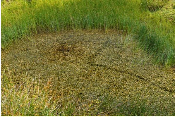
Figur 5. Vattenpest i våtmark 1C (enligt numrering i figur 2)

Det finns även två områden där man kan skapa nya grunda vatten för strandpadda (område 2 och 3 i figur 2, figur 6).