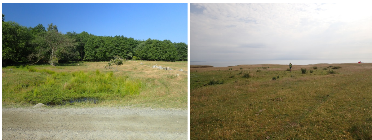
Figur 8. Områden där nya grunda vatten för strandpadda kan skapas. Till vänster i figuren område 5 och till höger område 6 (enligt numrering i karta, figur 7).