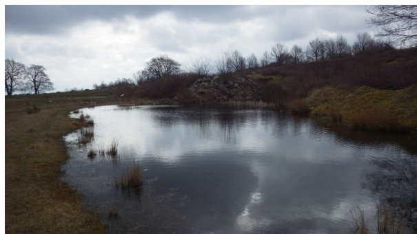
Figur 4. Område 4 (enligt numrering i figur 2) med tre vatten där vattenpest ska tas bort. Till vänster: våtmark 4C och 4B och till höger: våtmark 4A.