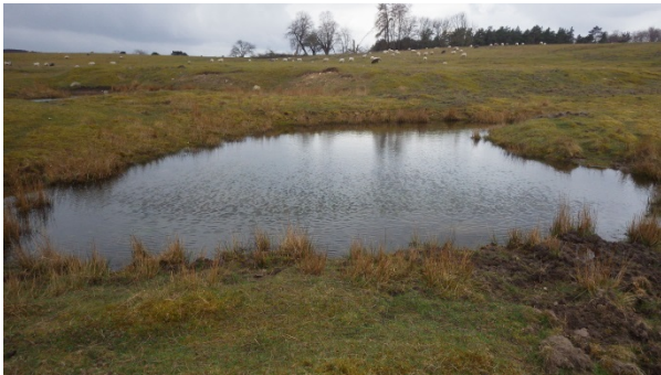
Figur 3. Vatten där vattenpest ska tas bort i område 1 (enligt numrering i figur 2). Överst till vänster: våtmark 1A, till höger: våtmark 1B och nederst till vänster: våtmark 1C.